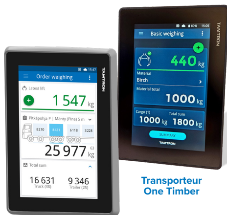
Camion One Timber