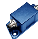
SENZOR ÚHLU X 4