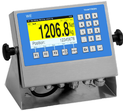
SEINÄ/PÖYTÄ- VERSIO Ruostumaton teräs kotelo seinä- ja pöytäasennukseen