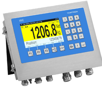
PANEELIASENNUS- VERSIO Ruostumattomasta teräksestä valmistettu kotelo asennettavaksi kytkentäkaapin aukkoon